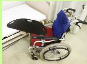
(スライディングボード)