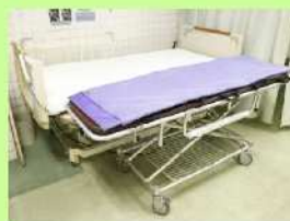
(スライディングシート)