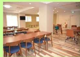
【職員専用の食堂(休憩室)】